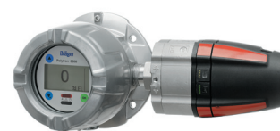
Dräger Polytron 8700 Взрывозащищенный датчик газов для контроля горючих газов.