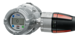
Dräger Polytron 8700 с присоединенной распределительной коробкой e-Box: версия с проводкой повышенной безопасности.

Одна конструкция, один принцип действия: Серия Polytron 8000