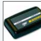
ИК канал передачи данных

Для получения полного списка принадлежностей обращайтесь в BW Technologies.