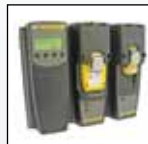
Совместимость с MicroDock II