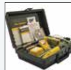
Насос отбора проб SamplerPak с двигателем привода